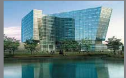
Hyatt Hotel te Dushanbe in Tajikistan