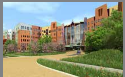
Isala Klinieken Zwolle