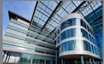
Faculteit betawetenschappen Utrecht