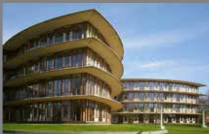
Saxion Hoge School Enschede