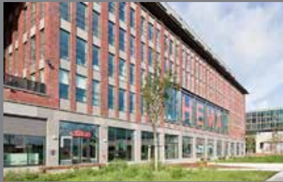
Hoofdgebouw HEMA/VNU Amsterdam