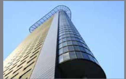
Woontoren Strijkijzer Den Haag