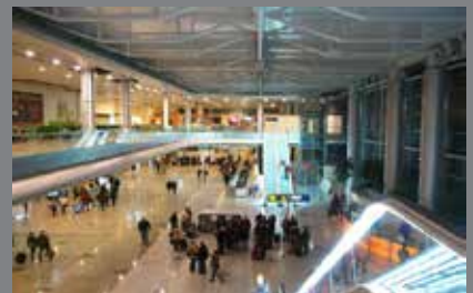
Vliegveld Shermentevo 3 Moskou