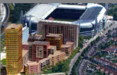
Multifunctioneel Complex Stadion Kwartier in Eindhoven