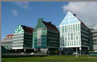
Stadhuis, busstation en gemeentearchief in Zaanstad