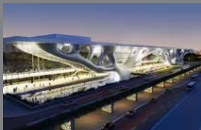
Convention Centre Doha Qatar