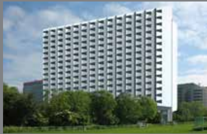
Studenten huisvesting Delft