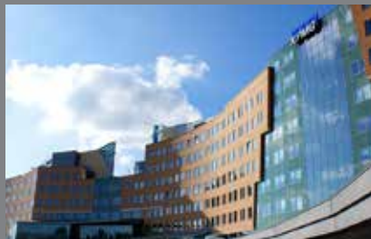
Hoofdgebouw KPMG in Amstelveen